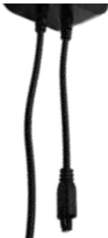
Receptor de IR (en la carcasa del adaptador)